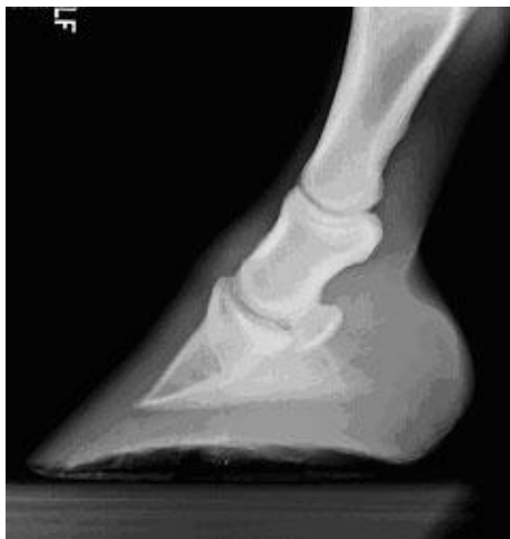
Röntgen kabja piirkonnast

6. Kui blokaadide abil loomaarst tuvastab, milline piirkond hobusele valu teeb, siis endiselt ei teata miks valu on tekkinud, ehk närviblokaadi abil ei saa panna lõplikku diagnoosi. Selleks on vaja valuliku piirkonna “sisse vaadata”. Kõige lihtsam viis on röntgen ja ultraheli . Esimene näitab luulisi muutusi (artroos, luukild, luumurd jne.), teine aga võimalikke vigastusi pehmetes kudedes (kõõluse-, sideme- või lihase rebend jne. ). Olenevalt haiguse tõsidusest ja kroonilisusest on täpne diagnoos nende meetodite abil võimalik. Ent teatud juhtudel ei aita ka see.