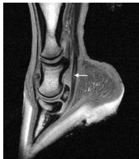
MRI kabja piirkonnast

7. Jala eri piirkondadesse “sisse vaatamiseks” on ka teisi võimalusi, mis kahjuks ei ole Eestis veel kättesaadavad. Uued tehnoloogiad , nagu magnetresonants kaamera, kompuutertomograafia ja sintigraafia, on viimastel aastakümnetel muutunud ka veterinaarmeditsiinis väga populaarseks. Lisaks sellele, et need meetodid annavad väga detailset informatsiooni erinevate kudede väljanägemisest, saab nende abil teha ka kolmemõõtmelisi ülesvõtteid, mis aitavad haiguskollet täpselt lokaliseerida. Sintigraafia ( ingl.k. scintigraphy/bone-scan ) on meetod, kus hobusele süstitakse radioaktiivset lahust verre, mis viib selle keha põletikulistesse piirkondadesse. Neid piirkondi, kus aine ladestub, ja seega intensiivsemalt kiirgab, otsitakse spetsiaalse kaamera abil. Kõige levinum on selle meetodi kasutamine luupõletike diagnoosimisel.